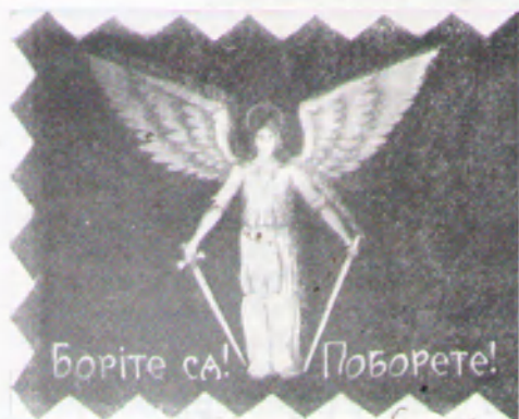
1. Прапор товариства „Сокіл-Батько“ у Львові (одна сторона). Фото 1911 р.