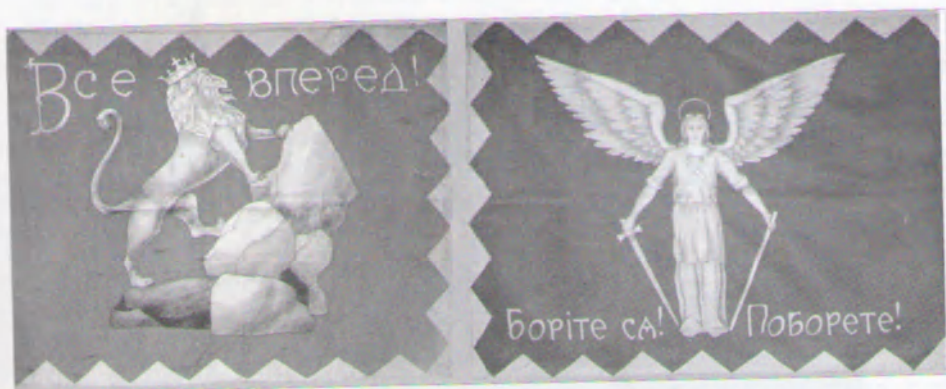
7. Прапор товариства „Сокіл-Батько“ у Львові. Сучасне фото