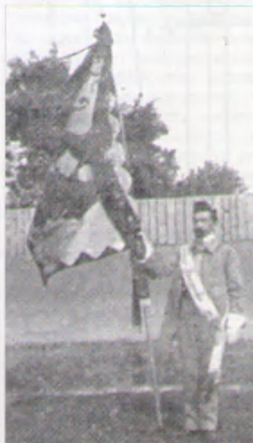
3. Хорунжий з прапором товариства „Сокіл-Батько“ у Львові. Фото 1911 р.