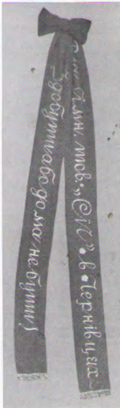
8. Стрічка до прапора товариства „Сокіл-Батько“ у Львові, надіслана від українського гімнастичного товариства „Січ“ з Чернівців. Сучасне фото