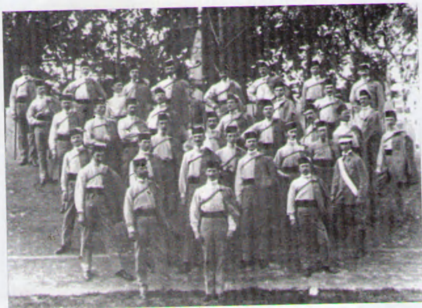
6. Члени товариства „Сокіл-Батько“ з прапором на Шевченківському здвизі у Львові. 28 червня 1914 р.