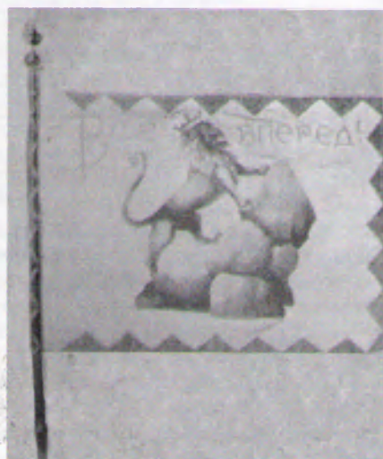
2. Прапор товариства „Сокіл-Батько“ у Львові (інша сторона). Фото 1911 р.