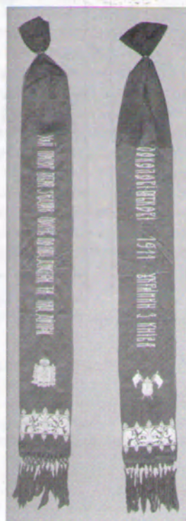
4. Стрічка до прапора товариства „Сокіл-Батько“ у Львові, надіслана від українців Києва. Сучасне фото