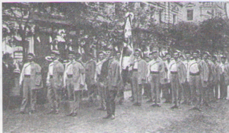
10. Українські соколи з прапором товариства „Сокіл-Батько“ на Всесокольському з'їзді у Празі. 30 червня 1912 р.