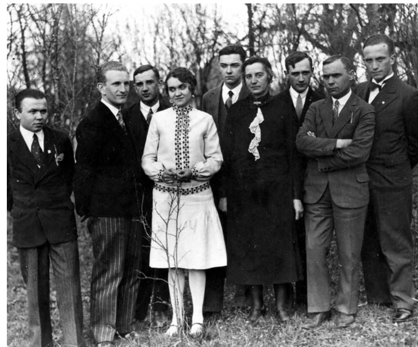
Зліва праворуч: невідомий, Роман Шухевич, невідомий, Наталя Шухевич, Юрій Березинський, троє невідомих, Юрій Шухевич. 1930 р.

концепція провадження визвольної боротьби, опертої тільки на власні сили українського народу. Ціла структура визвольно-революційного фронту, створена в умовах важкого протистояння з могутнім ворогом, цілковито себе виправдала. Це стало найбільшим успіхом Головного командира, і цей успіх — найкращий та найтривкіший пам'ятник для нього.