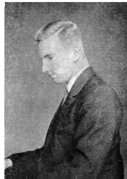
Роман Шухевич — піаніст

Після створення 2 лютого 1929 р. у Відні Організації Українських Націоналістів Р. Шухевич став бойовим референтом Крайової езекутиви ОУН (1930—1934). Завдяки Роману вдалося провести низку акцій, спрямованих проти антиукраїнської політики польської влади, зокрема: серію експропріаційних нападів на польські державні установи, які мали на меті залучити матеріальні засоби для ведення подальшої національно-визвольної боротьби 84 ; атентат 22 березня 1932 р. на комісара поліції Чеховського за знущання над українськими політв’язнями; екс 30 листопада 1932 р. на пошту в м. Городку, під час якого загинув Юрій Березинський, брат дружини Р. Шухевича; атентат на радянського консула у Львові на знак протесту проти штучного голоду в Радянській Україні (21 жовтня 1933 р. замах виконав бойовик ОУН Микола Лемик, убивши в консульстві спецуповноваженого НКВД Олексія Майлова); атентат на міністра внутрішніх справ Броніслава Перацького, організатора «пацифікації» (його виконав 15 червня 1934 р. в Варшаві бойовик ОУН Гриць Мацейко). У червні 1934 р. у зв’язку з убивством Б. Перацького поліція провела масові арешти серед членів ОУН. 18 червня арештовано Р. Шухевича і згодом, 6—7 липня, заслано до концентраційного табору в Березі Картузькій без достатніх доказів провини. У таборі Романа приписали до групи кочегарів, які взимку носили вугілля та розпалювали печі. Але й тут він очолив націоналістичну організацію самооборони. Один із таборових в’язнів