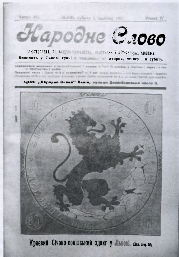
Світлина 4 – Заклик старшини українського гімнастичного товариства «Сокіл-Батько» до українців з нагоди проведення I Краєвого здви́гу, опублікований у часописі «Народне Слово». Львів, 1 квітня 1911 р.