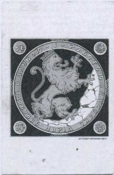
Світлина 5 – Листівка видана українським гімнастичним товариством «Сокіл-Батько» з нагоди проведення I Краєвого здвигу. Львів, 1911 р. Приватний архів Степана Гайдучка (м. Львів).

кермою Др-К.Трильовського, відказалися взяти участь в Здвизі для того, що посвячувало прапор С[окола]-Б[атька]. Яких 1.000 примірників цього афіша, відбитого на кращому папері, розіслано по здвизі на окрашу домівок читалень і сокільських гнізд. Рисунок цього льва використала Боева Управа під час світової війни до відзнаки на шапку для Українських Січових Стрільців» 14 . Малюнок «льва з короною, що стинається вправо на скалу» друкувався у галицькій пресі із закликом до українського громадянства на здвиг (світлина 4) 15 , а також був використаний на сокільській листівці (світлина 5) та плакаті-афіші (світлина 6) 16 .